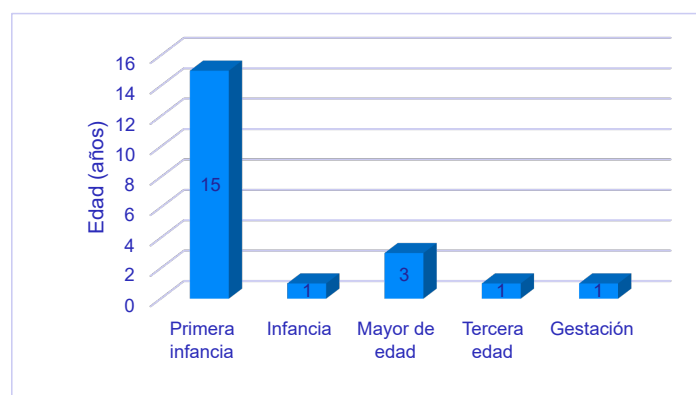
Gráfica 1. Reporte de Personas fallecidas de la comunidad Emberá en Bogotá, discriminados por rango de edad.

Así mismo encontramos que el 69% de los reportados pertenecen a Niños y Niñas en primera infancia de la comunidad Emberá, en donde el 32% son menores de 1 año.